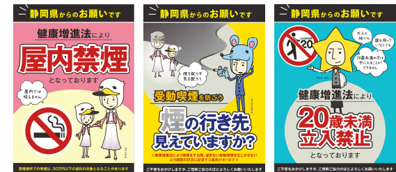
受動喫煙防止デザイン

掲示用ステッカーのデータは静岡県のホームページから無料でダウンロードできます。→ で検索