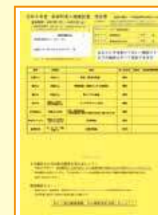
成人健康診査受診票(黄色)

受診票に記載されている全ての健(検)診が今年受けられる健(検)診です。対象の健(検)診は、できるだけ全て受けましょう。