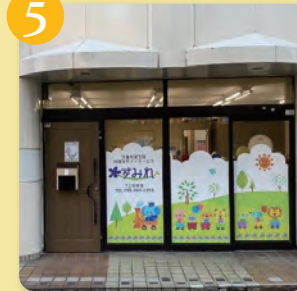
下土狩1289番地の10山恵ビル1階

すみれでは、 ・目で見たもの、感じたものを すぐ創作としてとり入れます。 ・集団で過ごすことで、コミュニケーション力を学んだり、思い思いやる気持ちが芽生えるようになります。 スタッフ一同、お子様と本気で向き合います。