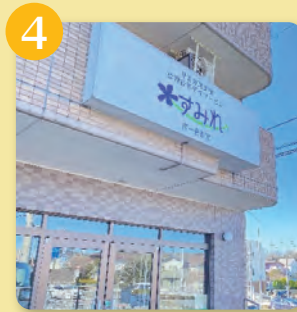
南一色 275-1 プラス 21 1F

令和5年4月1日開設。児童発達支援（未就学児・定員30名）、放課後等デイサービス（特別支援学校の児童・定員10名）、保育所等訪問支援（幼稚園等在籍児）のサービスを実施。 【私たちの存在意義】『明るい未来を迎えに行く』 【私たちが掲げるゴール】 ・一人ひとりに、新しい力と、景色を。 【私たちの行動指針】 ・どんな時も、子ども理解から（assessment） ・発達段階・ライフステージに合わせて（select） ・将来、意味を持つスキルを（acquire） ・支援技術の向上並びに支援者自身のサポートを（update）