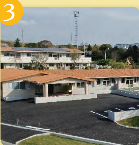
下長窪 1121 番地