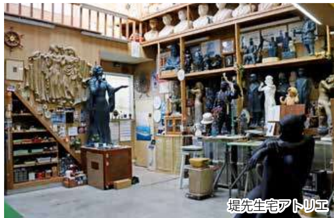
堤先生宅アトリエ