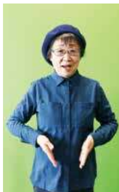
①両手をお腹の前で構えてから同時に少し湾曲させて前に出す