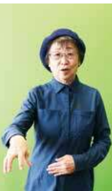
②右手全ての指を折り曲げて、下に向けておろす