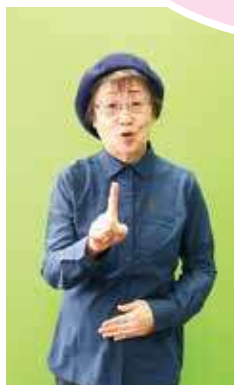
③人差し指を立てて左右に振る