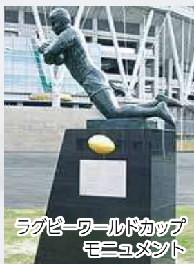
ラグビーワールドカップ モニュメント