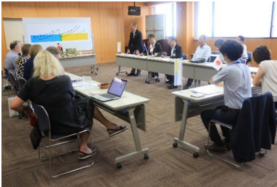
◀ 前回の市町長会談の様子

姉妹都市ニュージーランド・ワンガヌイ市から、アンドリュー・トライプ市長ら公式訪問団 6 名が、6 月 23 日から 25 日にかけて当町を訪れます。今回の訪問は前市長が 2018 年に姉妹都市提携 30 周年に訪れて以来約 8 年ぶりとなり、現市長は初めての来町となります。また、公式訪問団に合わせて親善訪問団 7 名も来町予定です。