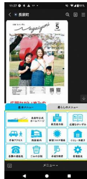
長泉町 LINE（登録者数 約 22,000 人）