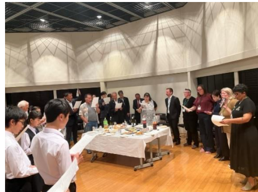
◀ 昨年度開催のウェルカムパーティーの様子