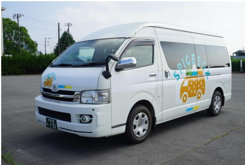
使用車両（スパイスボックス号）

本事業では、これまでの実証運行の結果を踏まえ、10 人乗りのワゴン車 1 台、5 人乗りの小型車 1 台を利用し、乗客の相乗りを許容しながら、距離に応じて運賃が 2 パターンとなるゾーン制運賃や電話予約（平日のみ）の導入、一部停留所の延伸を実施する予定です。