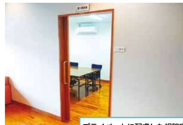
プライベートに配慮した相談室