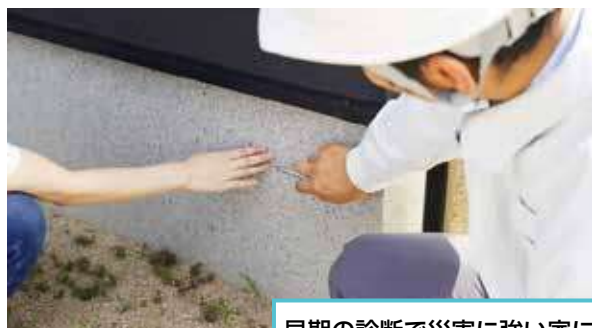
早期の診断で災害に強い家に