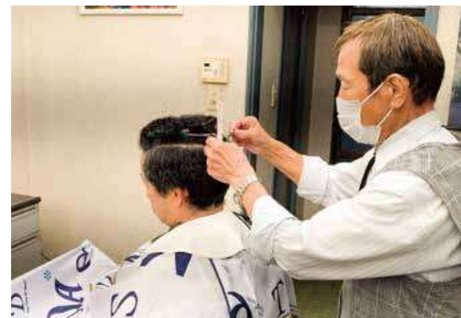
ヘアサロンでの散髪を自宅で