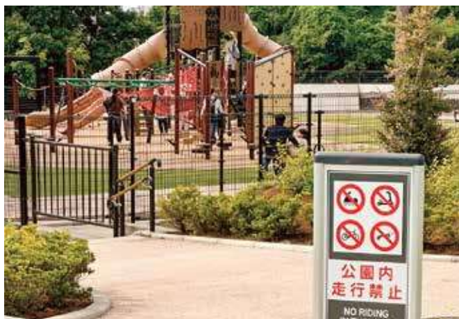
公園にもルールやマナーがあります。