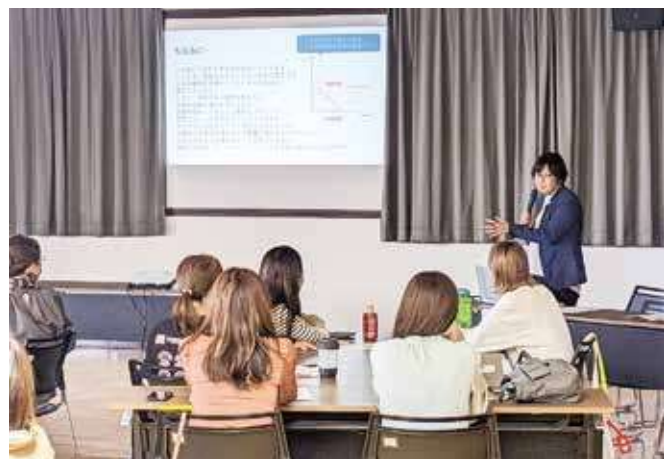
商工会と連携した起業創業支援の創業スクール