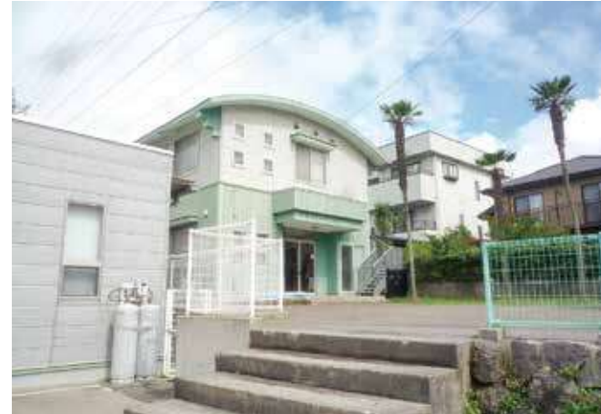
放課後児童会を登校時間前朝の子どもの居場所に