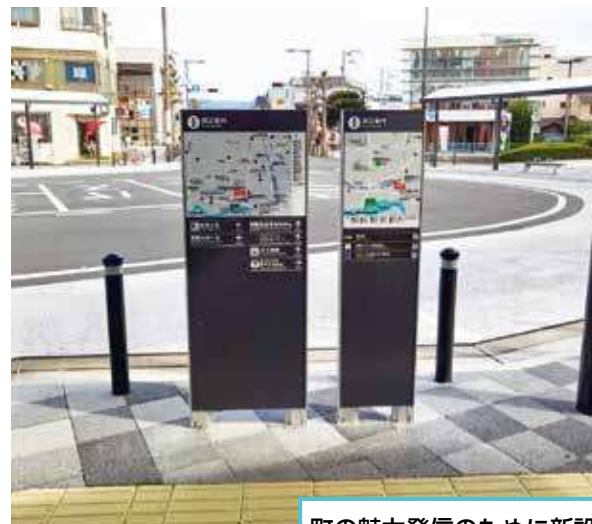
町の魅力発信のために新設

答 下土狩駅広場や、鮎壺公園の整備に合わせ、三島駅北口から下土狩駅周辺、鮎壺公園等を案内する歩行者案内誘導サインやジオサイト誘導サインを設置したことで、来訪者から回遊性が増したという意見を伺っている。