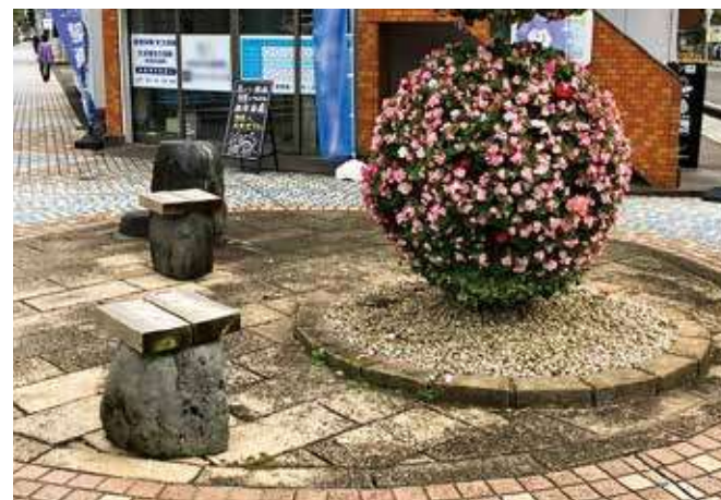
ベンチ増設で高齢者が歩きやすい歩行空間を