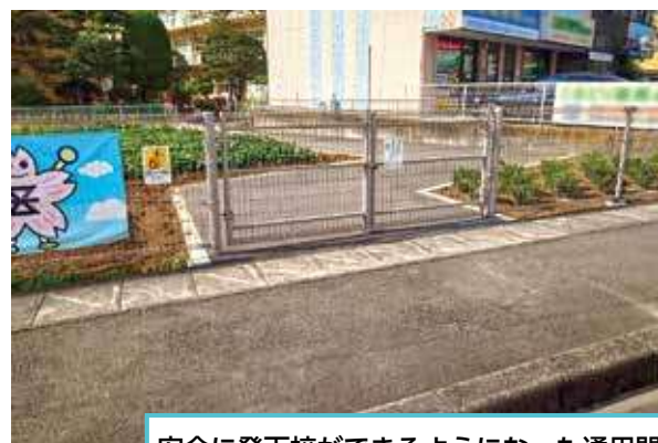
安全に登下校ができるようになった通用門

答 新たに学校の東側に通用門を設置したことで、南側歩道の混雑が緩和され、より安全に児童が登下校できるようになった。なお、町道から東側通用門までの歩道整備により生じた残地については、2年生と特別支援学級児童の学習用の畑として利用している。