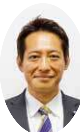
杉森 賢二 国民民主党 4期 駿河平区