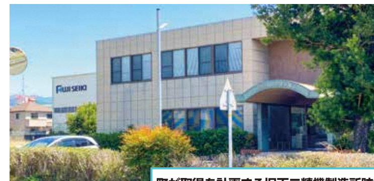
町が取得を計画する旧不二精機製造所跡地

町の旧不二精機製造所跡地取得に向けた検討を受け、緊急で特別委員会を設置。用地利活用の可能性や財政面への影響などを調査し、さまざまな視点で用地取得の妥当性を協議しました。候補地は町中心部であることから大規模な財源確保が必要であるものの、校舎の老朽化や多様化する教育・保育ニーズへの対応など、 未来 を見据えた教育施設整備のために必要な投資であると判断。第1回臨時会で町に用地取得に向け積極的に動くことを求める提言・決議を行いました。続いて開かれた第2回臨時会では、用地取得費用の補正予算が計上され、 全会一致 で可決しました。