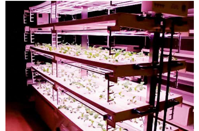
農業にイノベーションを。AOI-PARC内の次世代実験装置。