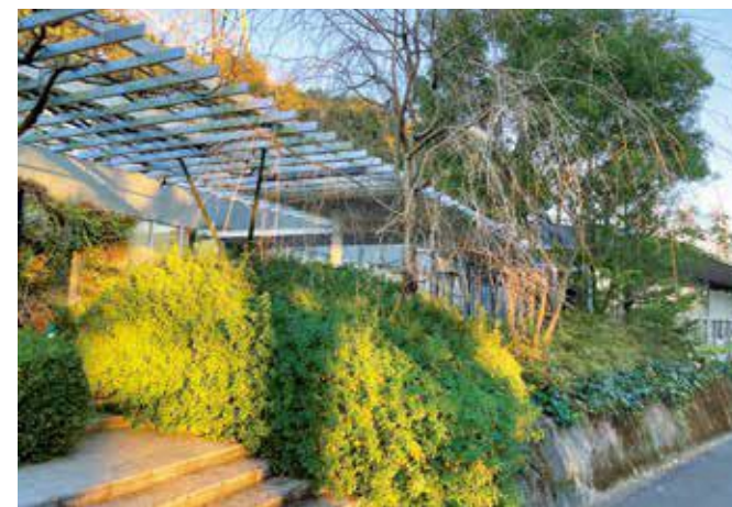
草木が生い茂るクレマチスの丘。(令和5年12月撮影) 新たな活用策に期待。

旧ヴァンジ彫刻庭園美術館跡地は地域の宝として次世代に繋がるよう、町は財政支出を含め積極的な姿勢を示すべきだ。