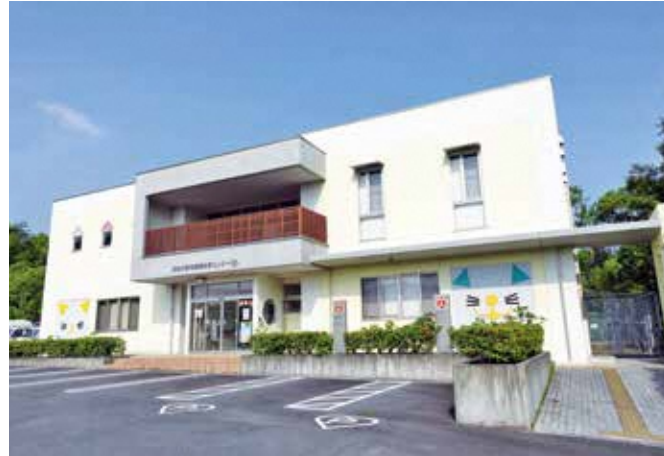
浜松市の動物愛護教育センター