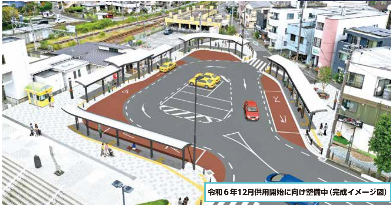
令和6年12月供用開始に向け整備中(完成イメージ図)