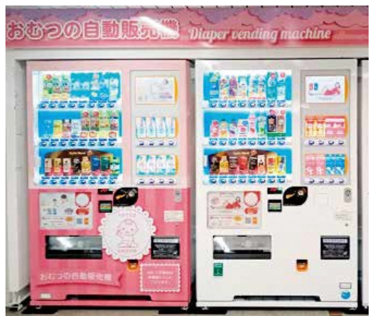
優しいまちづくりに「あったらいいな」。全国でも設置が進むおむつやおしりふきが購入可能な子育て支援自動販売機。

令和7年3月オープン予定の鮎壺公園。子育てのまち長泉らしい、さらに利用しやすい公園づくり・環境づくりの推進を。