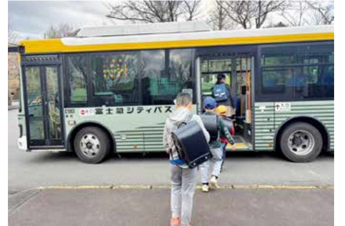
4月から減便の駿河平路線バス。小中学生の登下校時間は維持されたが、存続のため今後観光などバスの利用が不可欠。