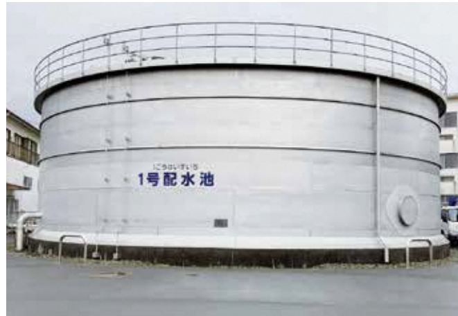
“水”は命です。水道施設の安全度を高めた耐震対策及び防災対策を。