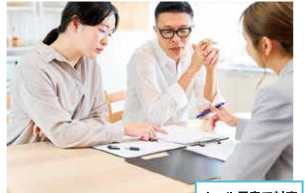
オール長泉で対応

問 民間事業者との連携など支援の方法は。 答 介護や子育て、障がいなど各分野の事業所と連携を図り、生活困窮などのさまざまなケース対応に取り組む。また、支援が行き届いていない方へのアウトリーチ支援事業や個別性の高いニーズに対応する参加支援事業などを予定している。