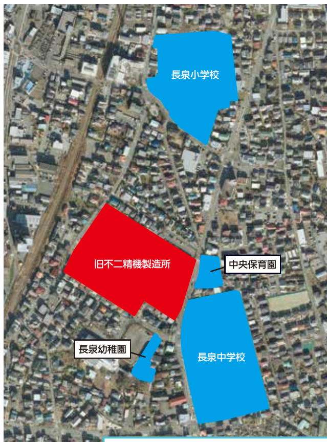
用地取得で、未来を見据えた教育施設の一体的整備が可能となる。

議員のお作法 ▼ 緊張する一般質問。胸に手を当て深呼吸。気を引き締めて質問席へ。