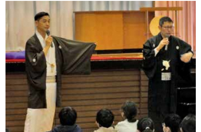
長く続いている小学6年生の「古典芸能に親しむ会」のように、情操教育や体験を与える教育を。