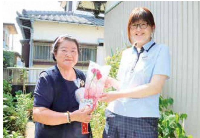
定期的な訪問により高齢者の見守りに一役。