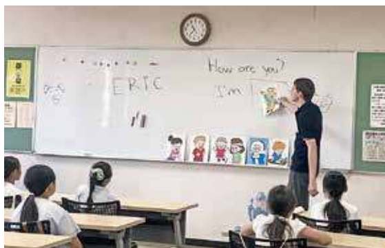
▲なじみのある表現を使ってウォーミングアップ

ポイントを増やすゲームなど、全員と話せる機会を意識した内容でした。最終日はみんなでカラフルな紙飛行機を作り、飛距離を競うアクティビティで締めくくりました。初参加の子どもからは「英語が楽しくなった」や、毎年参加の子どもの中には「留学に行ってみた」などの感想も聞くことができました。