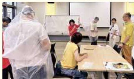
▲日赤の方の指導で雨合羽作り