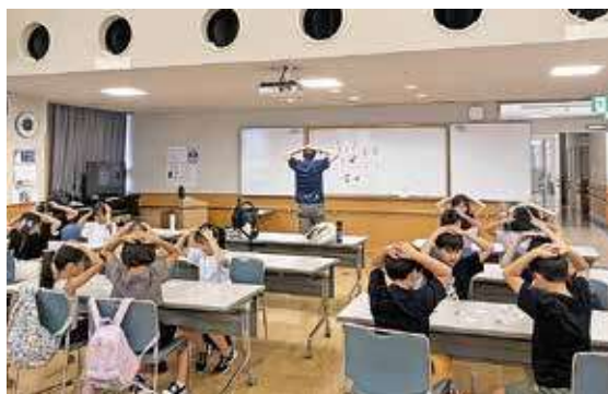
▲先生の言葉に全集中のキーワードゲーム