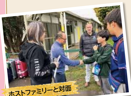
ホストファミリーと対面

8月16日(土)～24日(日)、町内中学生12人が姉妹都市であるニュージーランド・ワンガヌイを訪問し、ホームステイなどをしながら、現地の学校へ通い、英語や異文化を学びました。ホストファミリーと緊張の初対面、学校の友達とすぐに打ち解ける生徒たち、最終日にはホストファミリーとの別れを惜しみ涙を浮かべる姿が見られるなど、短い期間でしたが充実した研修を送りました。