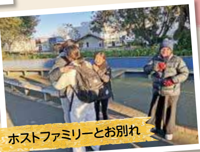
ホストファミリーとお別れ