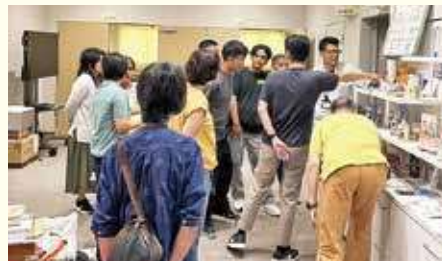
▲防災センターの見学