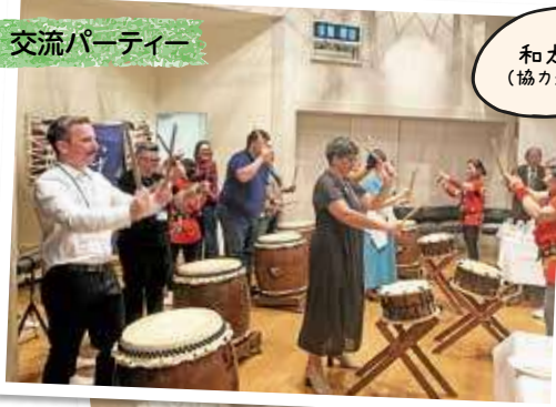
和太鼓演奏 (協力:いずみ太鼓)