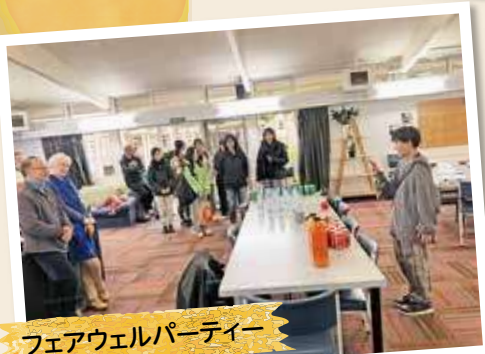
フェアウェルパーティー