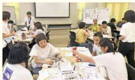
▲持ち寄った防災グッズについて対話交流