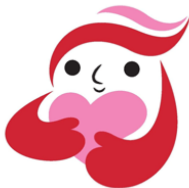
犯罪被害者等支援シンボルマーク「ギュっとちゃん」

犯罪被害を取り巻く環境に対して適切に対応するため、計画期間内であっても、適宜計画の見直しを図ります。