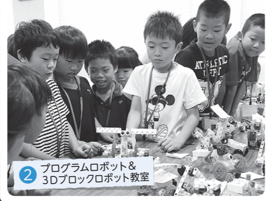
2 プログラムロボット&3Dブロックロボット教室