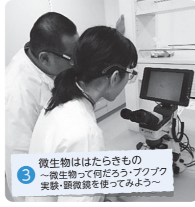
3 微生物ははたらきもの ～微生物って何だろう・ブクブク実験・顕微鏡を使ってみよう～