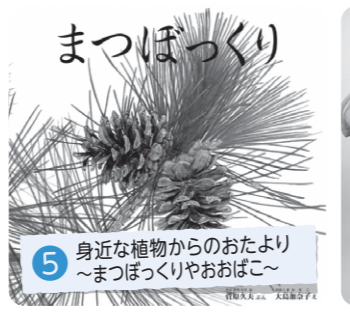
5 身近な植物からのおたより ～まつぼっくりやおおぼこ～