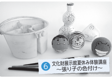
6 文化財展示館夏休み体験講座 ～張り子の色付け～