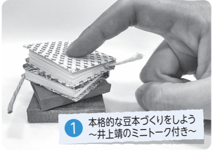
1 本格的な大豆づくりをしよう ～井上靖のミニトーク付き～