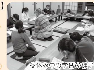
冬休み中の学習の様子