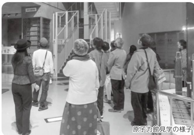
原子力館見学の様子