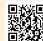
▲申し込みフォーム