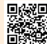
▲申し込みフォーム