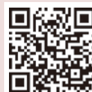
▲第3回申込フォーム