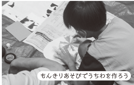
もんきりあそびでうちわを作ろう