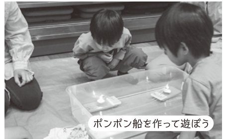
ポンポン船を作って遊ぼう