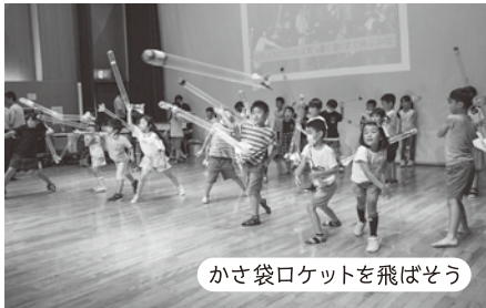
かさ袋ロケットを飛ばそう