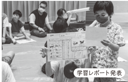
学習レポート発表