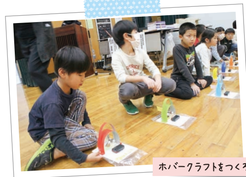
ホバークラフトをつくろう

7月から11月にかけて、全3回の「長泉宇宙の学校」を開催しました。講師の指導のもと、親子で実験や工作に挑戦し、家庭での学習レポート作りにも取り組みました。町内の親子38組が参加し協力しながら科学の不思議を学び、発表を通して学びの成果を共有しました。