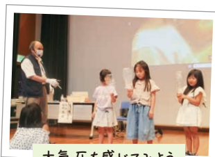
大気圧を感じてみよう