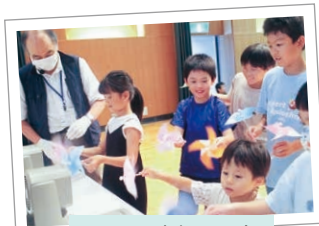
かざぐるまをつくろう