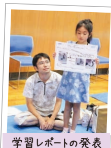
学習レポートの発表