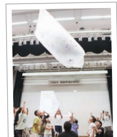
みんなで熱気球をあげよう

【発行】 長泉町教育委員会生涯学習課 〒411-0943 静岡県駿東郡長泉町下土狩 1283-11 コミュニティながいずみ内 電話：055-986-2289 ファックス：055-988-7802 メール：syogai@town.nagaizumi.lg.jp