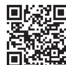
▲町ホームページ ▲申込フォーム