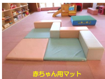
赤ちゃん用マット

大きな窓から明るい日差しが入るお部屋に、年齢に合わせたおもちゃを用意してあります。全面マットを敷いてあるので、足元にも優しく、赤ちゃん用のマットも用意しているので安心です。お子さんを遊ばせながら、お母さんも子育てや町の情報交換の場の1つとしてご利用ください。