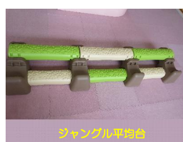
ジャングル平均台