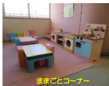
ママごとコーナー