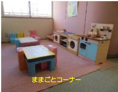
ままごとコーナー