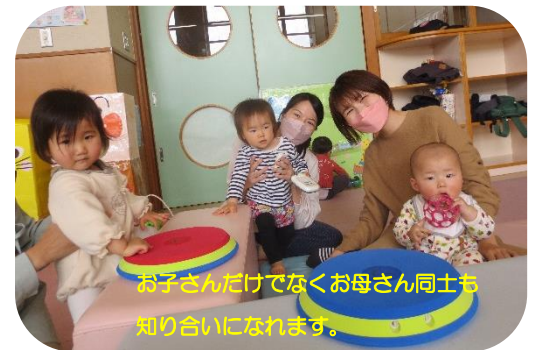
お子さんだけでなくお母さん同士も知り合いになれます。