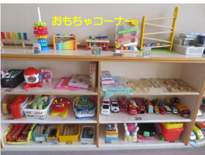
おもちゃコーナー