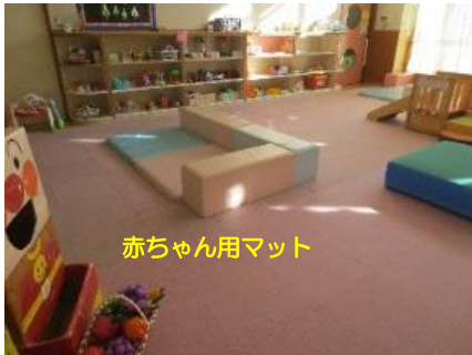
赤ちゃん用マット

大きな窓から明るい日差しが入るお部屋に赤ちゃんから遊べるおもちゃが用意してあります。全面マットを敷いてあります。お子さんやお母さんのペースでのんびり過ごせます。