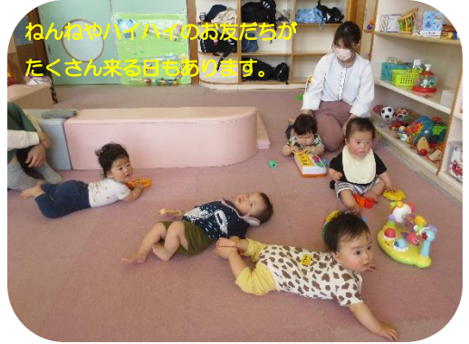
ねんねやハイハイのお友だちがたくさん来る日もあります。