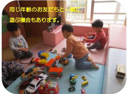
同じ年齢のお友だちと一緒に遊ぶ機会もあります。