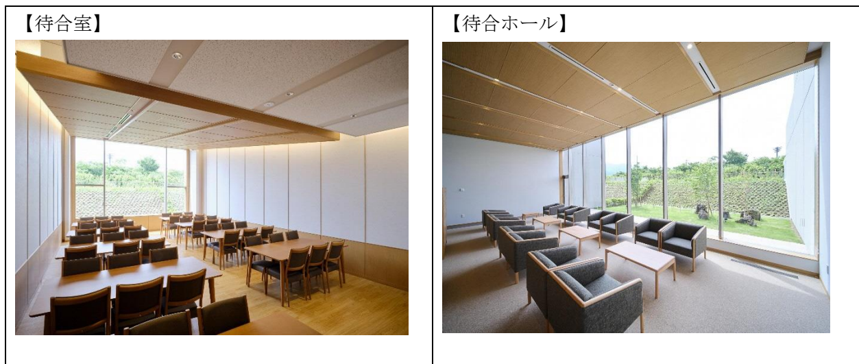
図 2.2 各諸室の写真