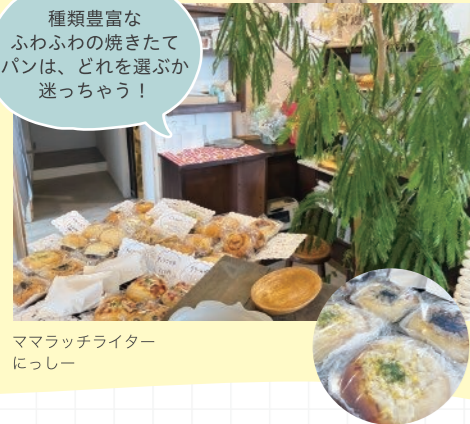
ママラッチライター にっしー