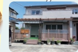
ママラッチライター chaki