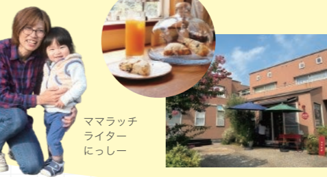
ママラッチライター にっしー

JR長泉なめり駅徒歩2分、納米里公園西側にあり、子どもと訪れやすいお店です。一箱ごとにオーナーがいる本棚が並ぶ私設図書館とカフェが併設され、親子で気軽に本と触れ合えます。さまざまなイベントも開催され、世代や職業を超えたつながりを見つけられる場所です。