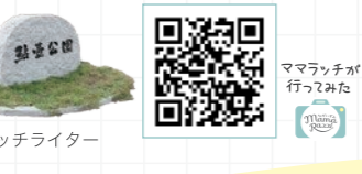
ママラッチライター サトミ

〒長泉町下土狩1069-1 ② 駐車場 9:00~18:00 / 鮎壺テラス 9:00~17:30 ③ あり(40台)