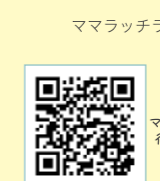
ママラッチライター chaki