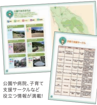
公園や病院、子育て支援サークルなど役立つ情報が満載!

ママにはもちろん、パパやおじいちゃんおばあちゃんにも、損する情報はひとつもありません。 子どもたちは情報通のパパが大好き! 晴れた日に子どもと出かけた公園や、地域ごとに定期開催される子育て支援グループの情報など、この冊子には、長泉町の通な情報がいっぱい! ほかには、急に具合が悪くなった時の病院や病児保育情報、休日にも開所している子育て支援センターの情報や、お仕事に復帰されるパパママには保育園情報、学童期には放課後児童クラブの情報などを掲載しています。 赤ちゃんから学童期までの幅広い年齢のお子さんに合わせて、さまざまな情報が本当にたくさん盛り込まれています。