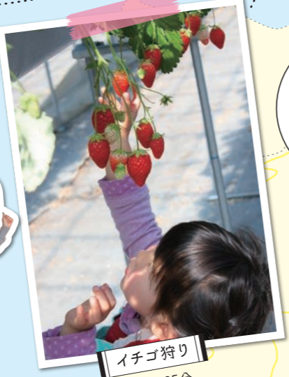
イチゴ狩り 車で約25分