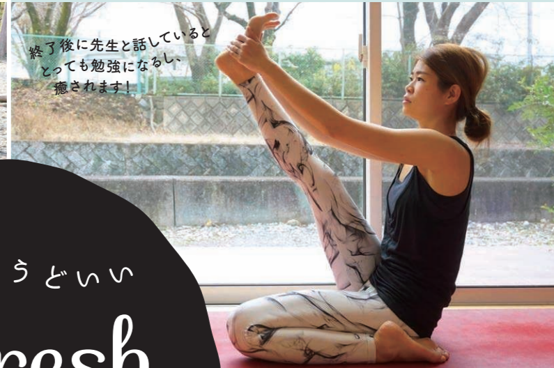
終了後に先生と話しているととても勉強になるし癒されます!