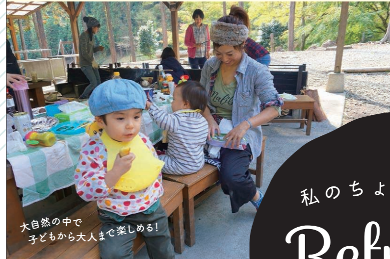
大自然の中で子どもから大人まで楽しめる!