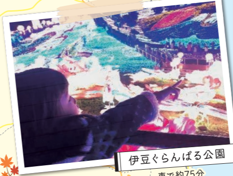
伊豆ぐらんぱる公園 車で約75分