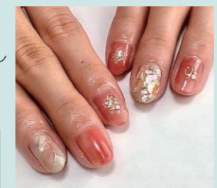
ネイリストさんのトークが面白い!