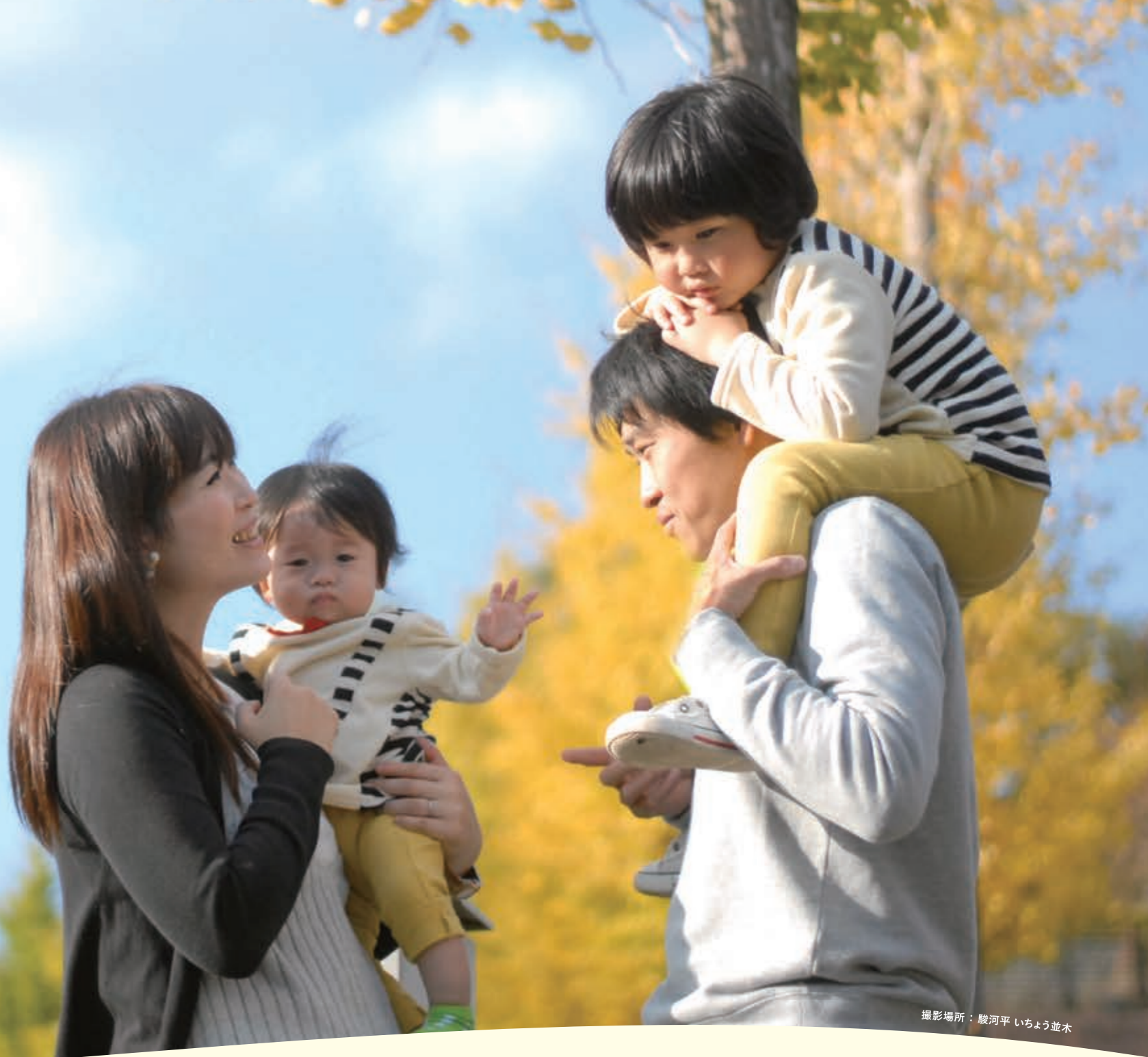
撮影場所：駿河平 いちよう並木