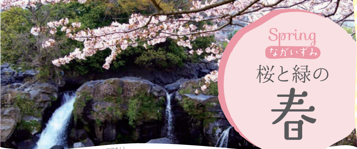
Spot お花見 鮎壺の滝