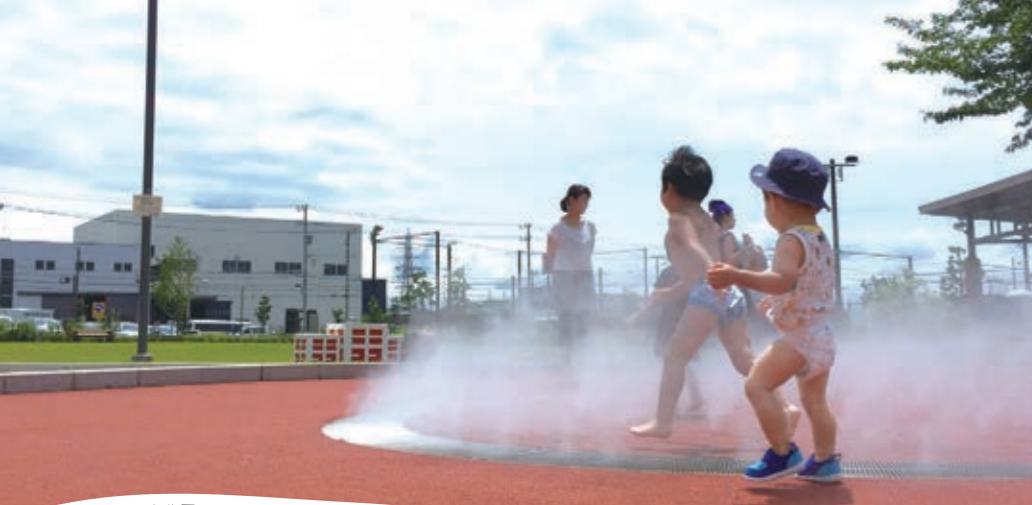
長泉町健康公園ニコニコ広場