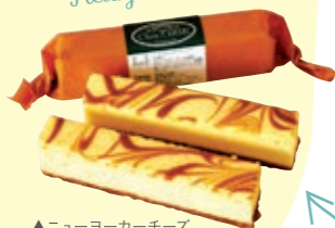
▲ニューヨーカーチーズ 1本 200円(税込)

お店のイチオシ商品は「ニューヨーカーチーズ」。濃厚なチーズの味わいや土台部分のザクとした食感はもちろんのこと、持ちやすく食べやすく、手頃なお値段も人気の秘密! 贈答品にもおやつにもピッタリですね!