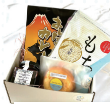
長泉町:長泉ブランド 認定品セット