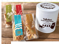
富士宮市:特産品セット