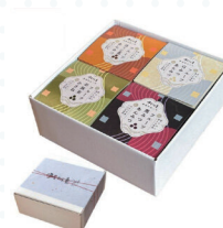
清水町:あんみつセット