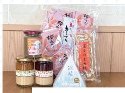
富士市:特産品セット