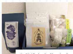
御殿場市:御茶・珈琲・ 御菓子セット