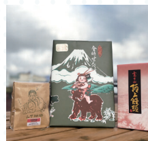
小山町:特産品セット