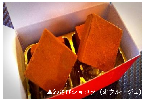
▲わさびショコラ（オウルージュ）