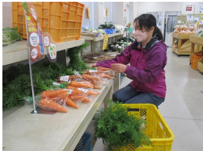
ファーマーズへの初出荷の様子