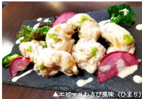
▲エビマヨわさび風味（ひまり）