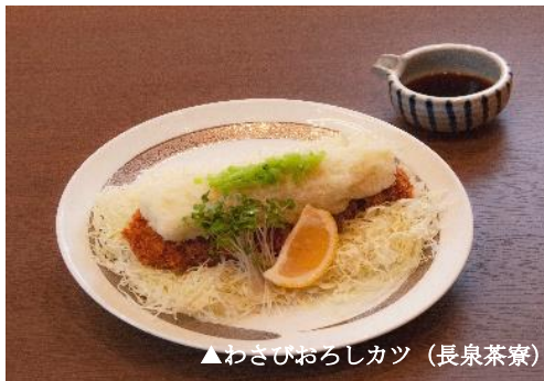
▲わさびおろしカツ（長泉茶寮）