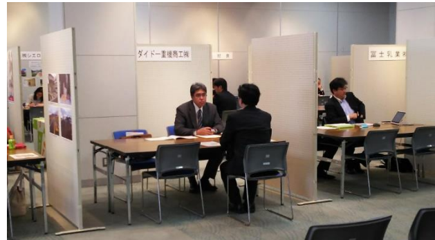
（平成29年開催時写真）