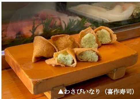
▲わさびいなり（喜作寿司）