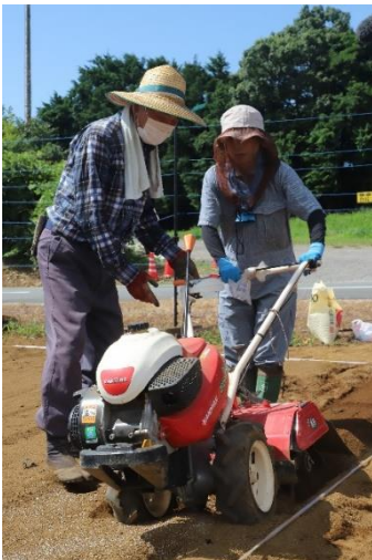
地域農業者に教わりながら作業する研修生