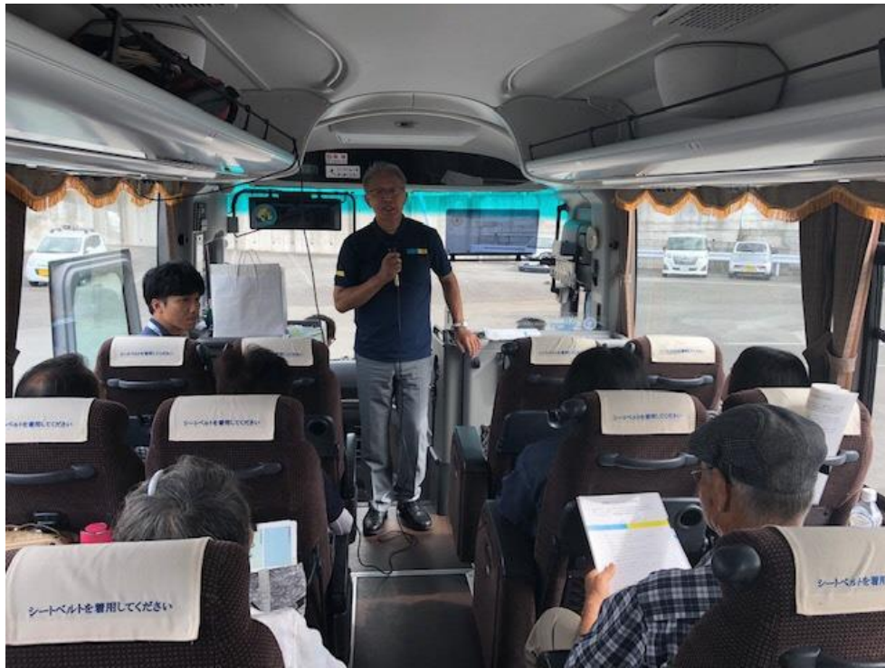
8 月 9 日（金）、第 1 回目の様子

町の魅力を実感してもらうため、町内企業や公共施設などを巡るバスツアーを開催します。町が誇る特産品を使ったランチを食べたり、世界に誇る“Made in ながいずみ”を知ったり、もっとこの町のことを知ってもらいたいという気持ちを込めたバスツアーです。定員 60 人に対して、予想を大幅に上回る 250 人を超える申し込みがありました。