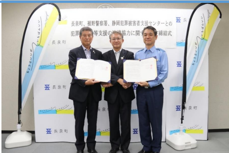
平成 30 年 9 月 25 日（火）、犯罪被害者等支援の連携協定に関する協定締結式の様子

平成 30 年 10 月、県内の町として初めて単独の犯罪被害者等支援条例を施行しました。本条例に基づき、より細やかで効果的な支援を行うための計画を策定するため、本町と裾野警察署、静岡犯罪被害者支援センターの計 9 人の委員が議論を重ね素案を作成。パブリックコメントの結果を踏まえ 10 月 1 日からスタートします。