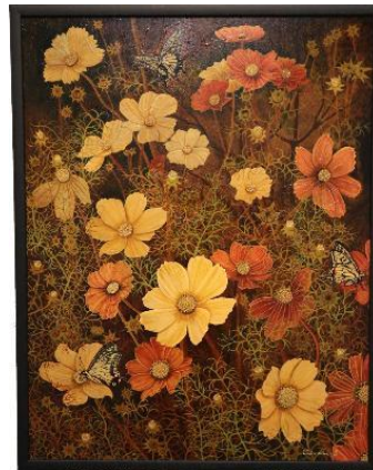
昨年度の大賞受賞作品