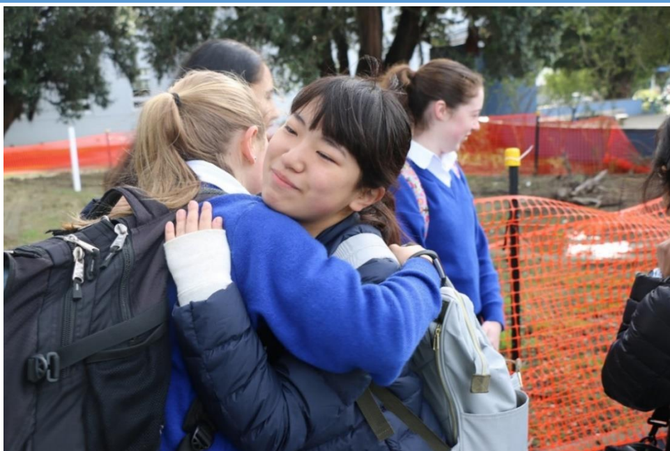
昨年度の短期語学研修支援事業（ワンガヌイ市への訪問）の様子

昨年度、ニュージーランド国ワンガヌイ市との姉妹都市提携 30 周年を迎えました。30 周年を契機として更なる交流を図るため、9 月 8 日（日）から 11 日（水）まで、ワンガヌイ市内にあるラザフォード中学校の学生 3 人がホームステイをしながら、町内の中学校を訪れ交流を深めます。ワンガヌイ市からの学生の訪問は平成 25 年以来で、今までに延べ 215 人の学生が本町を訪れています。