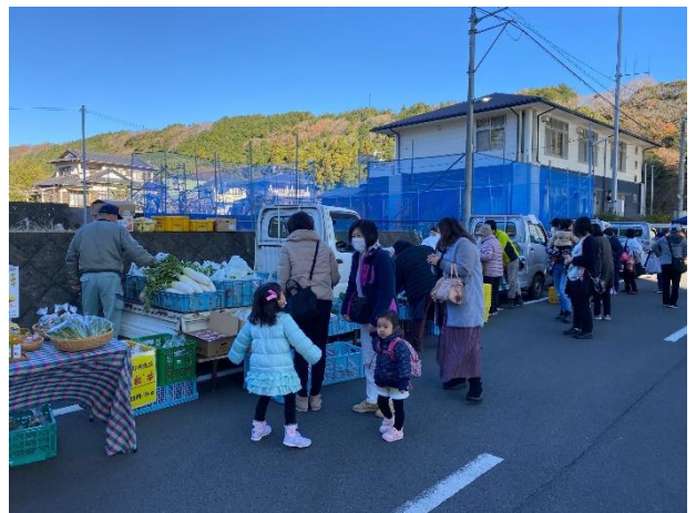
昨年の軽トラ市の様子