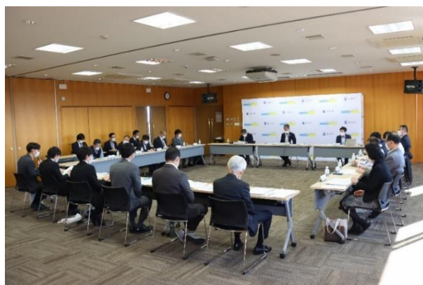
令和4年度第3回長泉町地域公共交通協議会（10月31日）