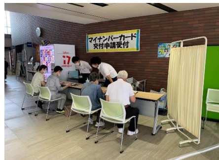
ウェルピアながいずみ