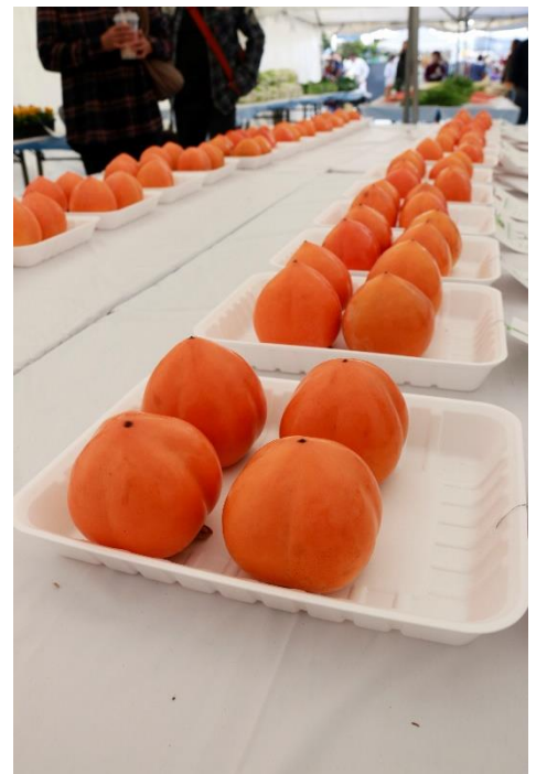
令和元年度産業祭の様子（品評会）