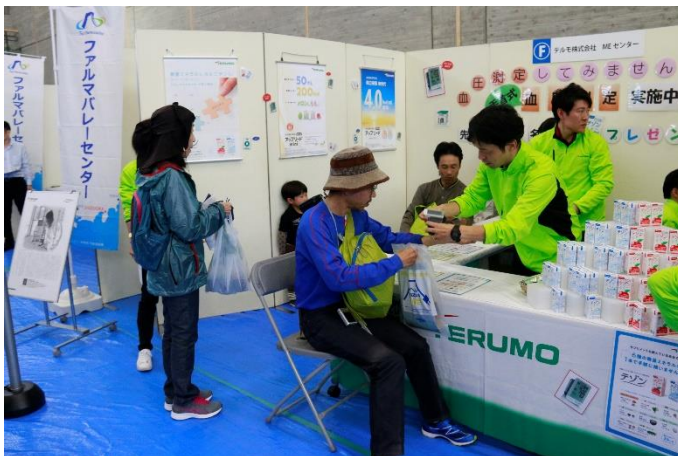
令和元年度産業祭の様子（工業展）