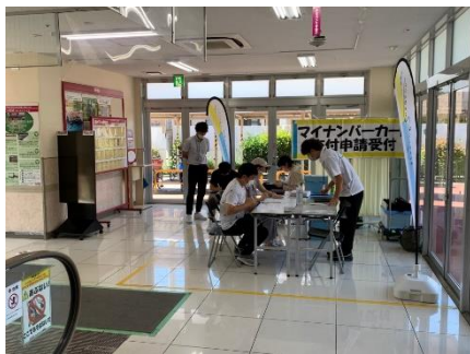
マックスバリュ竹原店