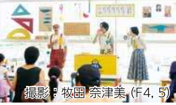
撮影：牧田 奈津美 (F4, 5)