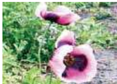
▲アツミギシ(セティゲルム種)