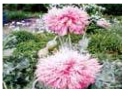
▲ケシ(ソムニフェルム種)