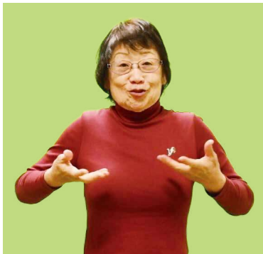
▲手の甲を下にし、両手を胸の前で上下に動かす