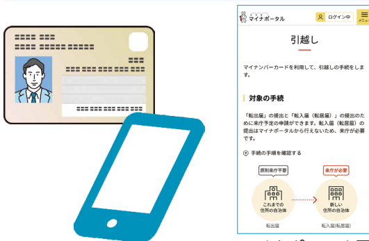
▲マイナポータル画面