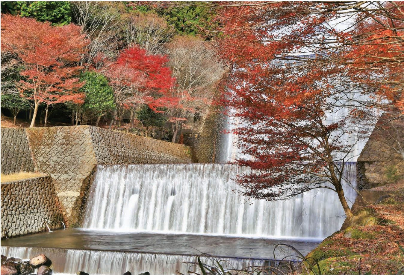
撮影地／水と緑の杜公園