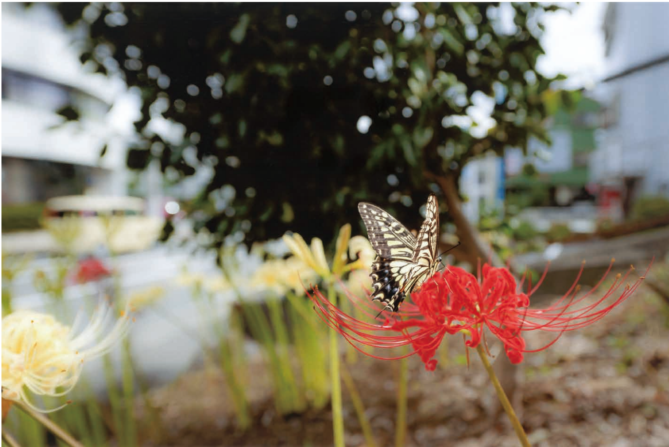
撮影地／割狐塚稻荷神社