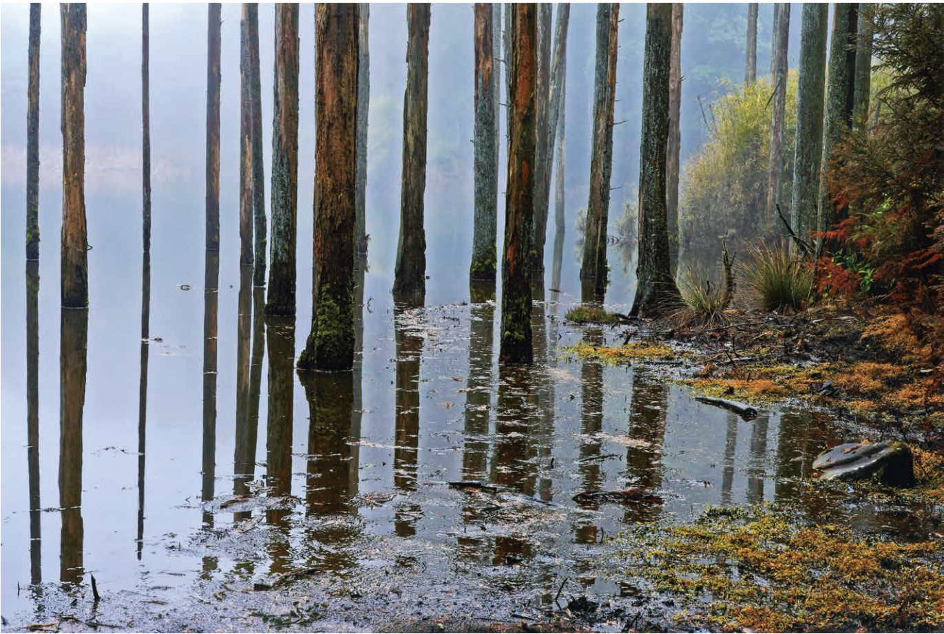
撮影地／桃沢砂防ダム湖