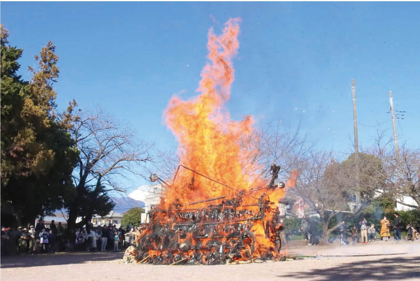
撮影地／割狐塚稻荷神社