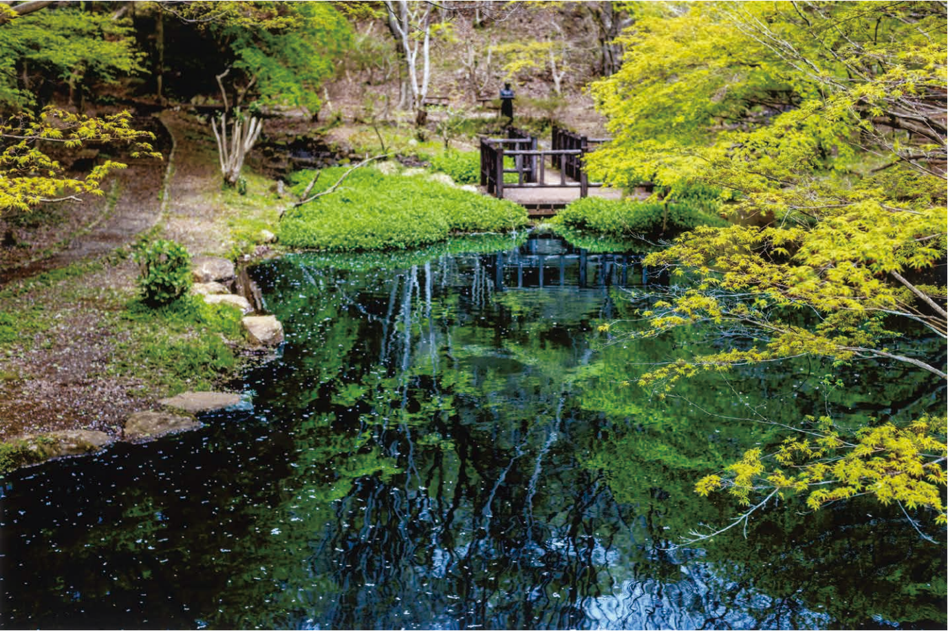
撮影地／駿河平自然公園