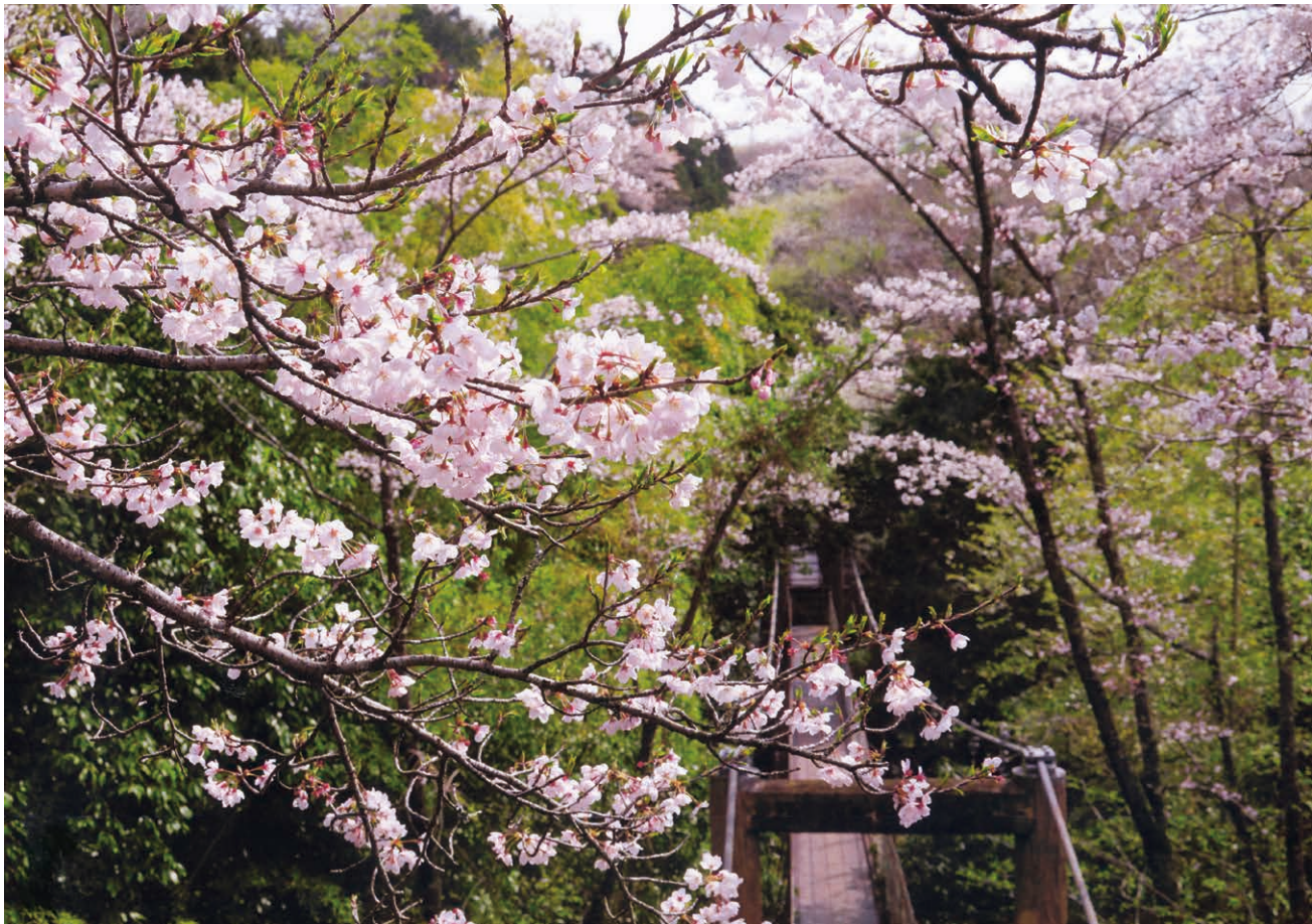
撮影地／駿河平自然公園