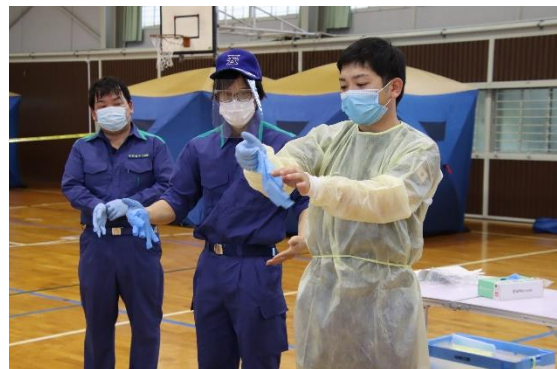
(写真：町職員対象訓練の様子)