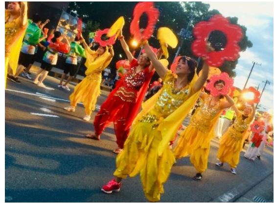
※第23回長泉わくわく祭り写真コンテスト受賞作品