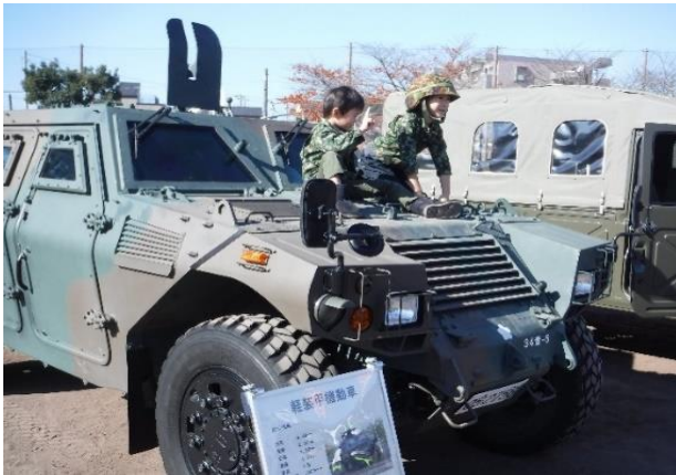
【自衛隊による車両展示】

当日は、自衛隊による救出救助訓練の実演やドローン操縦実演、ライフライン事業者など民間事業者の協力を得て、防災に関する出展ブースや実体験型訓練を行います。