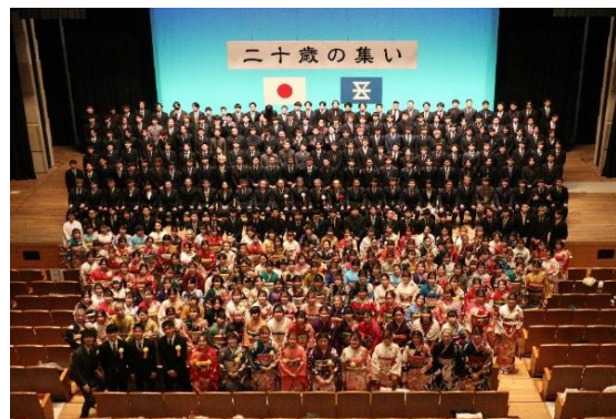
令和 5 年の集合写真