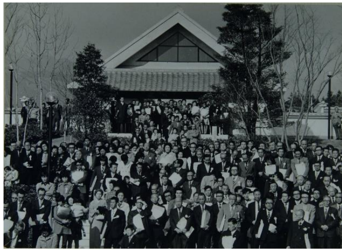
昭和 48 年開館セレモニー