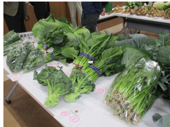
昨年の産業祭の様子