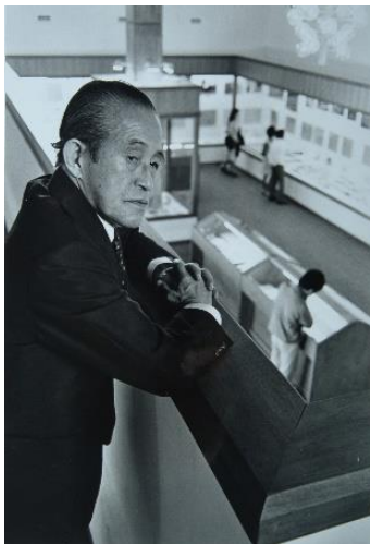
井上靖文学館 本人来館時

なお、当式典は今年度、静岡県が東アジア文化都市事業の選定を受けており、地域の活性化や観光、文学の振興・発展を県内外に発信するという趣旨に合致するものであり、この認証プログラムとして実施するものです。