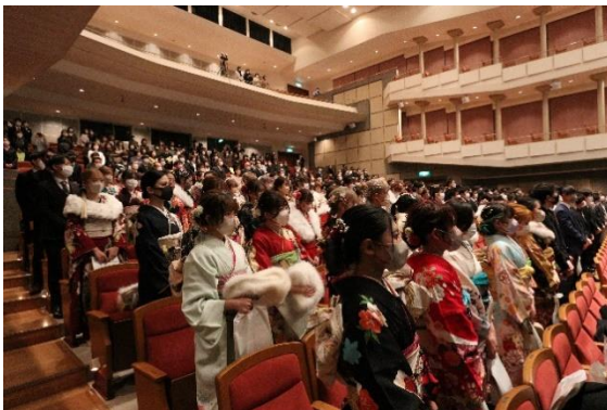
令和 5 年の式典の様子