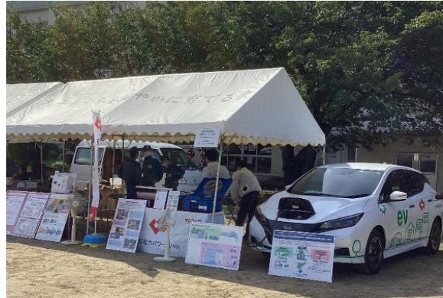
【EVからの給電体験・VR体験】