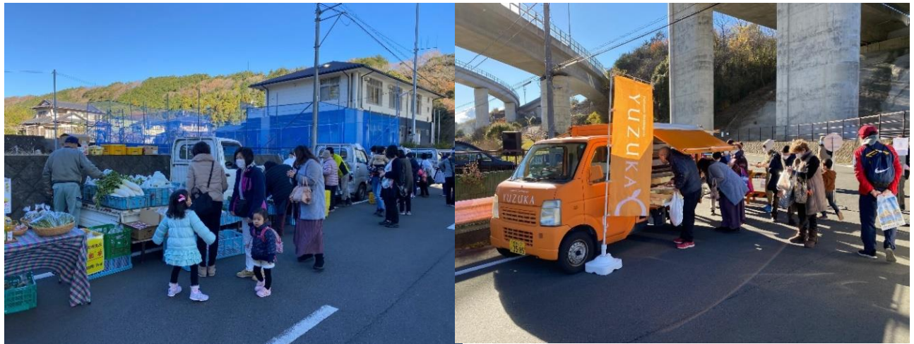
軽トラ市開催の様子